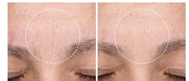
Vorher Nachher (4 Wochen)