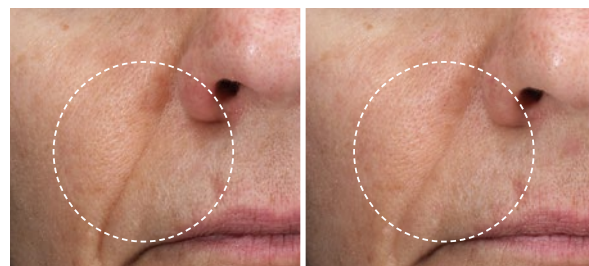
Vorher Nachher (4 Wochen)