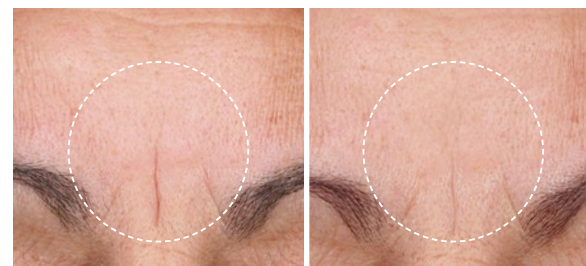
Vorher Nachher (4 Wochen)