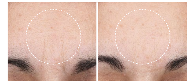
Vorher Nachher (4 Wochen)