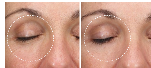
Vorher Nachher (4 Wochen)