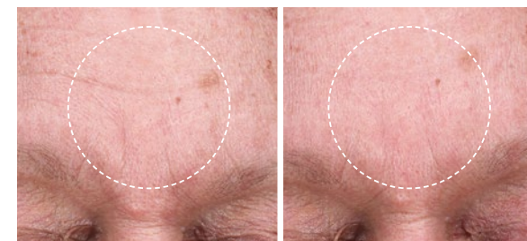
Vorher Nachher (4 Wochen)