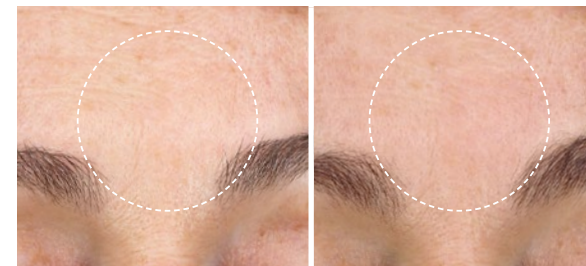
Vorher Nachher (4 Wochen)